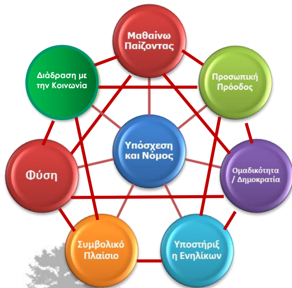
Η Προσκοπική Μέθοδος

Η αποστολή του Προσκοπισμού είναι να συμβάλει στην αγωγή των παιδιών και των νέων, μέσω ενός συστήματος αξιών, το οποίο είναι βασισμένο: Στην Προσκοπική Υπόσχεση και το Νόμο, για να βοηθήσει την οικοδόμηση ενός καλύτερου κόσμου, όπου οι άνθρωποι γίνονται ολοκληρωμένα άτομα και διαδραματίζουν έναν εποικοδομητικό ρόλο στην κοινωνία.