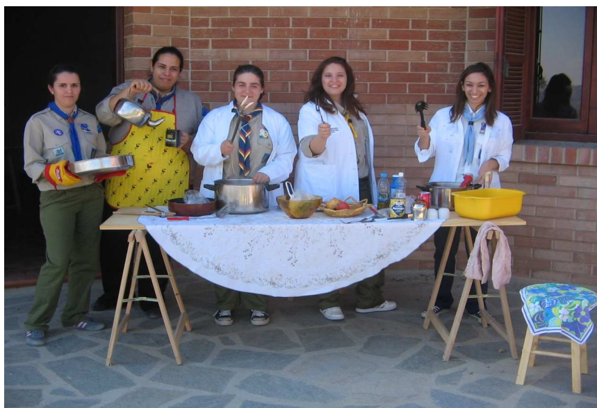
(Θεατρικό εργαστήρι, Κόρνος, 2011)

Αποστολή στον Κλάδο Λυκοπούλων της Γ.Ε. του Μηνιαίου προγράμματος, ολοκληρωμένου, πριν την υλοποίηση του.Φωτογραφικό υλικό για κάθε συγκέντρωσης ξεχωριστά, που να αποδεικνύει όλα τα παραπάνω, μετά την λήξη του Μ.Θ.