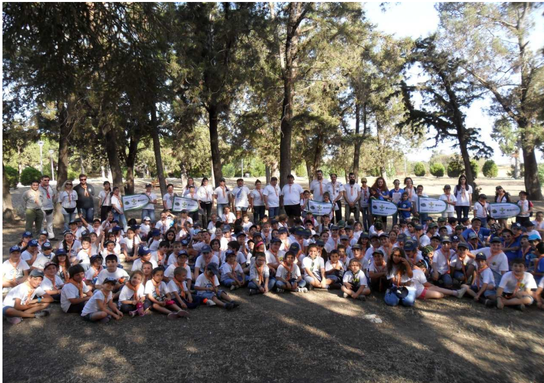
Φωτογραφία Αρχείου Κλάδου Λυκοπούλων Γ.Ε. (Πράσινη Αγέλη, Ε.Ε.Λάρνακας, 2013)

Ο έλεγχος θα διενεργηθεί για λογαριασμό του Κλάδου Λυκοπούλων της Γ.Ε. από την Εφορεία Διοικήσεως του Σ.Π.Κ. Η Αγέλη Λυκοπούλων θα πρέπει να καταθέσει γραπτά στοιχεία, που να αποδεικνύουν την αριθμητική αύξηση.