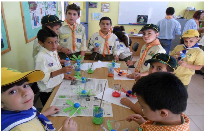
Φωτογραφία Αρχείου Κλάδου Λυκοπούλων Γ.Ε. (Πράσινη Αγέλη, Ε.Ε.Πάφου, 2013)

Ο πίνακας θα πρέπει να φωτογραφηθεί την ώρα την κατασκευής του αλλά και μετά την ολοκλήρωση του και να σταλεί στον Κλάδο Λυκοπούλων για αξιολόγηση μαζί με το πρόγραμμα συγκέντρωσης.