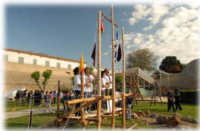
Ιστός από την 1 η ΑΜΦΙΚΤΙΟΝΙΑ