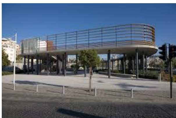
Πρόσοψη του χώρο