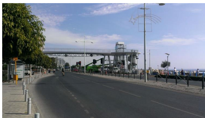
Η γέφυρα που θα χρησιμοποιηθεί για την μετάβαση