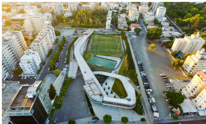
Εναέρια φωτογραφία του χώρου

Λόγω κάποιου κολλήματος που προέκυψε, ο χώρος διανυκτέρευσης των Υ/Κ μεταφέρετε στο οίκημα του ΓΣΟ που βρίσκεται ακριβώς απέναντι από το χώρο που θα διεξαχθεί το πρόγραμμα της δράσης. Η μετακίνηση των Ανιχνευτών θα γίνει μέσω της υπέργειας γέφυρας (όπως βλέπετε ποιο κάτω). Στο χώρο υπάρχουν τουαλέτες, μπάνια και χώροι στάθμευσης. Το σημείο άφιξης του Σαββάτου παραμένει το Blue café στο Μόλο.