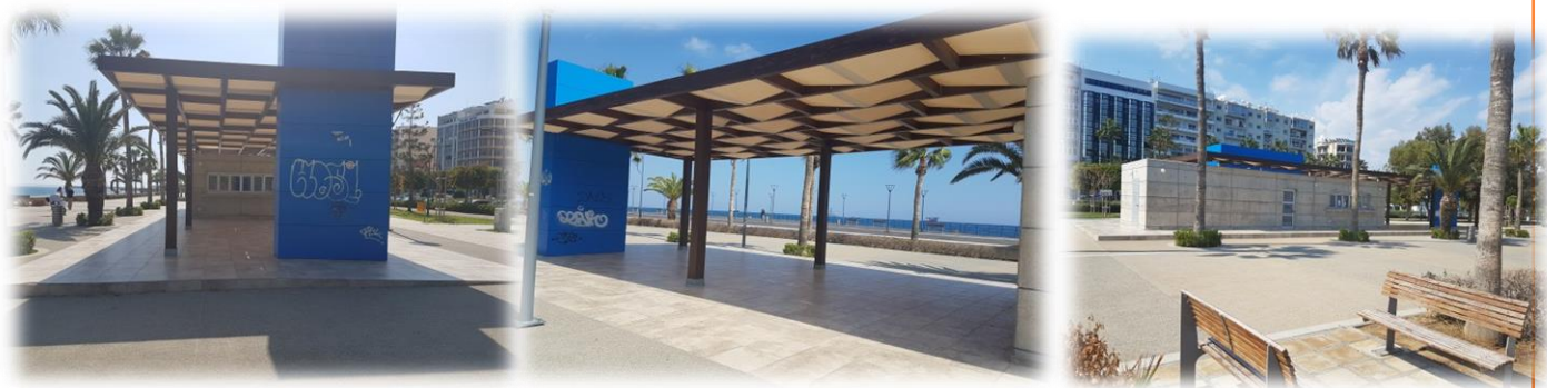
ΧΩΡΟΣ ΓΡΑΜΜΑΤΕΙΑΣ ΧΩΡΟΣ ΙΑΤΡΕΙΟΥ 2 ος ΧΩΡΟΣ ΤΟΥΑΛΕΤΑΣ